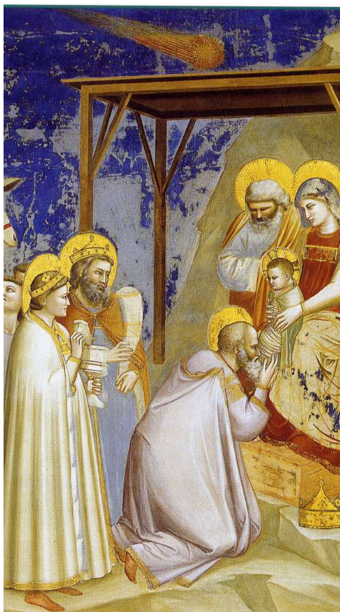
Giotto, Adorazione dei Magi (part.), 1303-05, Padova, Cappella degli Scrovegni

Il legame tra tutto questo è la stella: la stella che guida i magi nel loro viaggio fino a Betlemme, le stelle a cui ancora oggi molti si affidano per trovare senso e speranza nella vita quotidiana, come se da esse dipendesse il nostro destino, le stelle a cui si affidavano gli antichi marinai per attraversare mari e oceani. Papa Leone così diceva agli studenti di ogni ordine e grado riuniti per il loro giubileo: «Da sempre i viaggiatori hanno trovato la rotta nelle stelle. I marinai seguivano la Stella Polare; i Polinesiani attraversavano l'oceano memorizzando mappe stellari. [...] Persino i Magi hanno seguito una stella per arrivare a Betlemme ad adorare Gesù Bambino. Come loro, anche voi avete stelle-guida: i genitori, gli insegnanti, i sacerdoti, i buoni amici, bussole per non perdervi nelle vicende liete e tristi della vita.