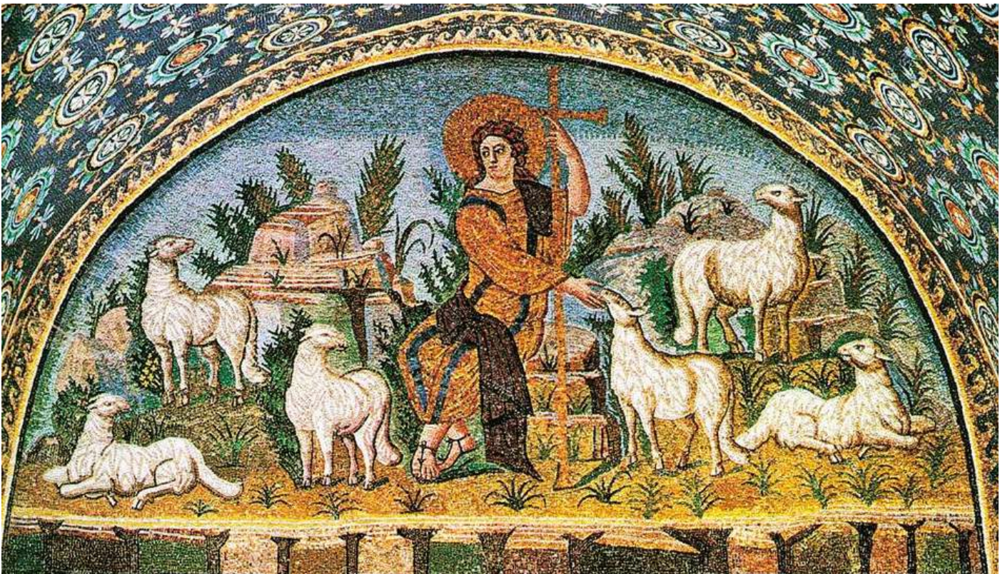
Il Buon Pastore, mosaico del V sec, Ravenna, Mausoleo di Galla Placidia