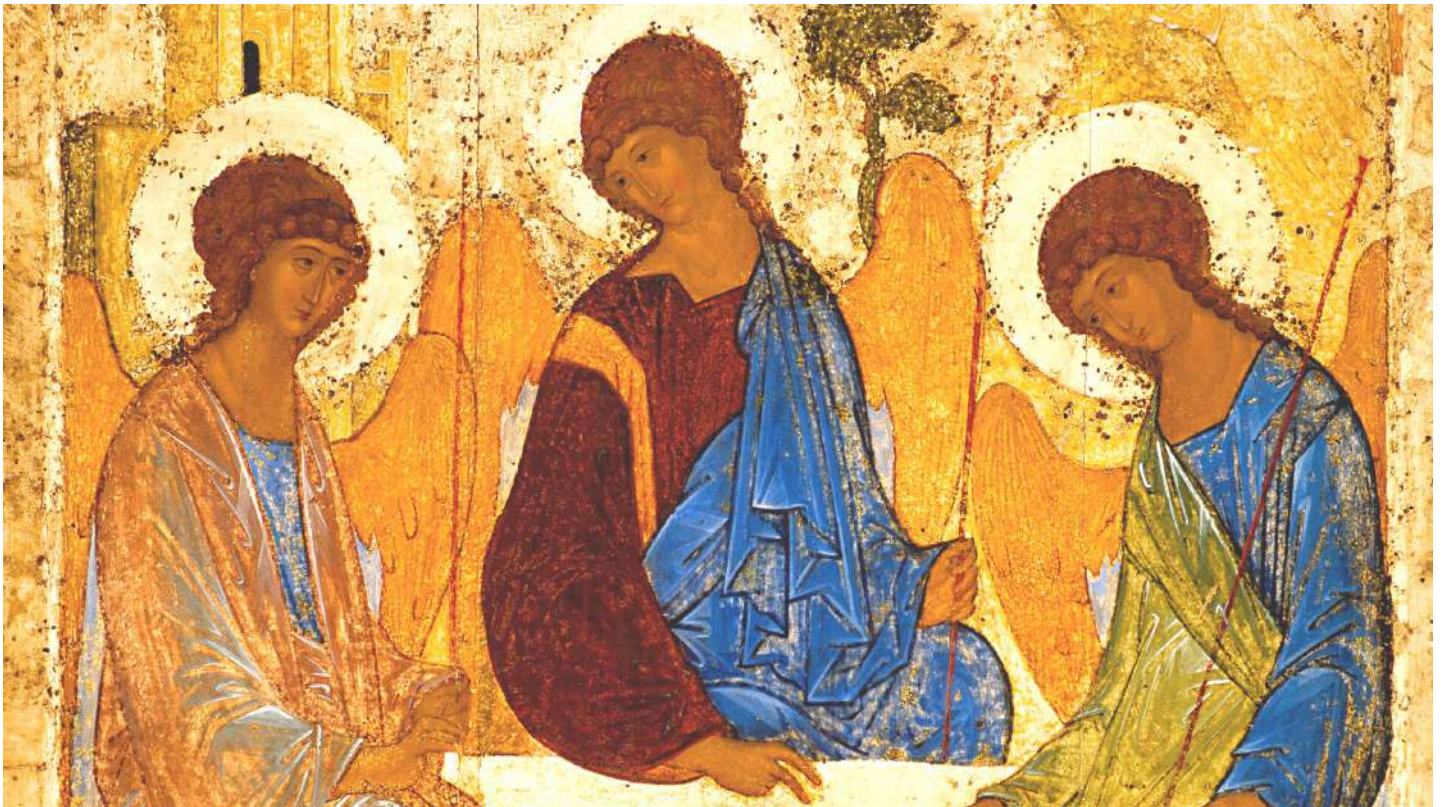
Andrej Rublëv, icona della Trinità, 1422, Mosca, Galleria Tret'jakov

La festa della SS. Trinità è come se ci portasse in cima a una montagna e ci mostrasse un meraviglioso panorama da contemplare nel suo insieme: il mistero di Dio, che guardiamo durante l'anno liturgico nelle sue diverse sfaccettature, ora ci è mostrato nel suo insieme, perché possiamo contemplarne tutta la ricchezza. Dio si mostra molto diverso da ogni idea che l'uomo potrebbe produrre e ha prodotto nel corso della storia. Dio non si mostra come il sovrano potente e dispotico che governa il mondo con un arbitrio imprevedibile e incomprensibile, che chiede la sottomissione degli uomini ad un volere insindacabile; non si mostra neppure come una presenza indistinta e informe che pervade tutto l'esistente. Si mostra invece come comunione e relazione : Dio non è chiuso in se stesso, ma è Dio famiglia, Dio