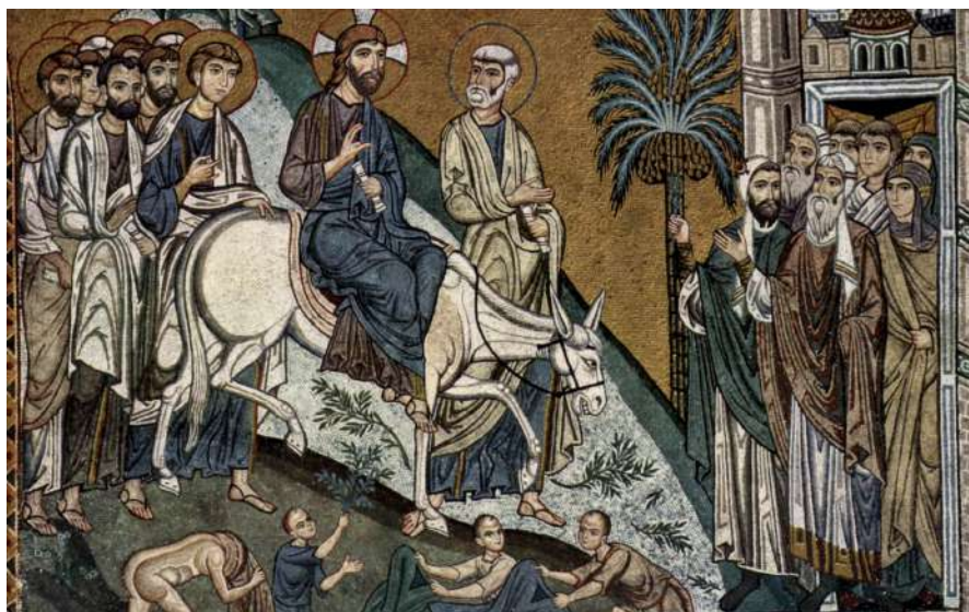
Ingresso di Gesù a Gerusalemme, mosaico del XII sec., Cappella Palatina, Palazzo dei Normanni, Palermo.